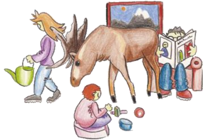
Zeichnung: Jörg Kreuziger

Suchtprobleme werden in den meisten Familien verleugnet. Es ist, als stünde ein Elch im Wohnzimmer, aber alle tun so, als wäre er nicht da. Alle Gefühle, die mit dem Elch zusammenhängen (Angst, Wut, Frustration) dürfen ebenfalls nicht ausgedrückt werden. Denn: Bei uns gibt es doch kein Problem, oder?